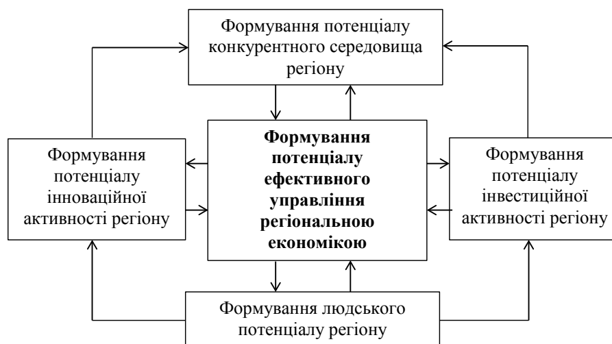
Рис. 2. Схема взаємозв'язків блоків формування потенціалів в керованій підсистемі

Проте, в реально існуючих системах, у всіх випадках чітко простежується необхідність виконання ряду загальних вимог, що пред'являються до взаємодії в системі управління, наприклад: спрямованість на ефективність досягнення цілей управління системою; забезпечення раціональної взаємопов'язаності з'єднання елементів в системі для досягнення синергетичного ефекту від їх взаємодії; забезпечення безперервності функціонування та розвитку системи управління; узгодженість (збалансованість) сил впливу в механізмі функціонування системи управління конкурентоспроможністю регіону [5, с. 54].